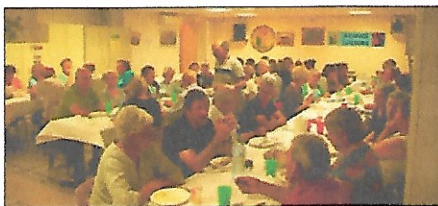
Vue partielle de l'assistance