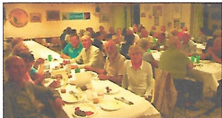
Place au casse-croûte pour terminer le Week-End

L'aventure est presque terminée mais à l'arrivée un copieux casse-croûte attend les marcheurs à Casteljaloux où la soirée s'est prolongée dans la nuit.