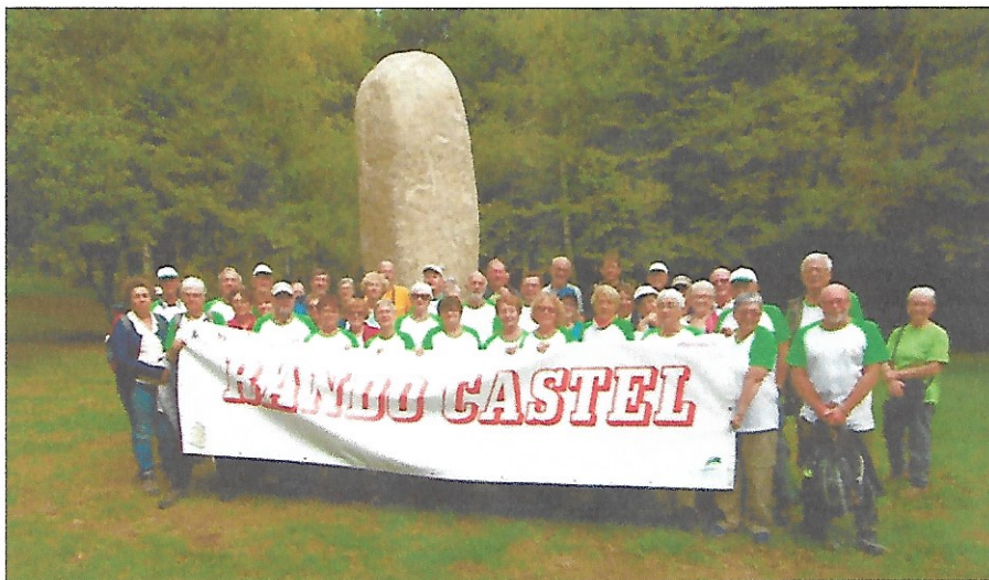
Le groupe au site du Sidobre

Le samedi 28 septembre les membres du club de randonnées Rando Castel, ont pris la route en direction de la Montagne Noire dès 6h00 du matin avec 51 randonneurs du Club.