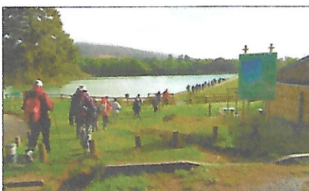
De beaux paysages

Là-haut découverte de la nouvelle passerelle (inau-