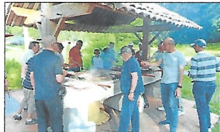
Puis les grillades prennent la suite

sonnes prennent part aux agapes. Tout le monde a mis la main à la pâte pour installer rapidement chaises et tables sans oublier le charbon de bois dans le barbecue. À 18 h 30, il était temps de se rafraîchir avec l'apéritif offert par le club, et l'ambiance est montée d'un cran, par cette belle soirée de fin de printemps. Une fois passé à table, chacun a sorti des