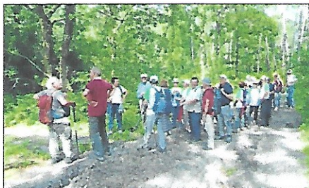
Ca commence par une balade en forêt

Jeudi dernier, comme tous les ans en fin de saison, les marcheurs de l'association Rando Castel ont associé randonnée et grillades à la Taillade.