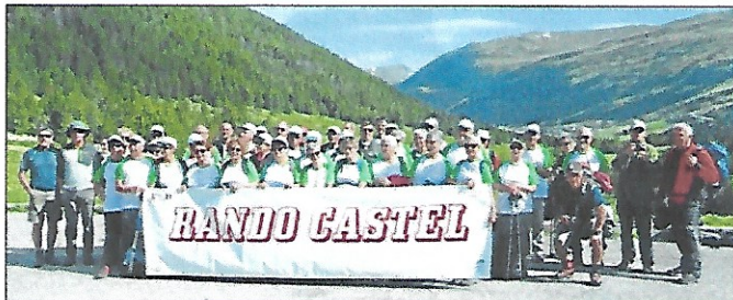
Le groupe parti en Andorre

Mi-juin 44 randonneurs de l'association Rando Castel ont répondu présent place de la Cardine à 07 h 30, pour embarquer dans un car en destination de la principauté d'Andorre et chacun s'interrogeait sur le programme car les difficultés ne manquent pas dans cette région. Beaucoup de randonnées étaient prévues entre 2000 et 2500 d'altitude et en point d'orgue pour certains, une nuit en refuge. Après un ar-